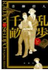
青柳 碧人 新潮社 Fア

怪人二十面相の作者である江戸川乱歩。ユダヤ人を救うため、ビザを発給した外交官、杉原千畝。この二人が物語の中で友人となり、お話が進みます。その時代背景も描かれているので、想像をしながら読んでみてください。