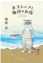
標野 凧 KADOKAWA BFシ

人生に悩み思い詰めてしまった人たちが迷い込む、海辺が舞台のお店。饒舌で料理上手なネコシェフがふるまうのは、とびきり美味しい海の幸を使ったごはん。じんわり温かい気持ちになれる物語です。海辺で料理をふるまっているネコシェフを想像しながら読みました。内容も優しくほっこり癒されます。