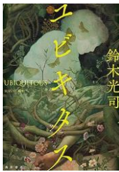
鈴木光司 KADOKAWA Fス

南極観測の土産として持ち帰られた氷に、現代には存在しないはずの殺人バクテリアが潜んでいた。原因不明の連続突然死事件を追う探偵・前沢恵子は、かつて新興宗教団体で起きた出来事との不気味な共通点に気づく。物理学者・露木と共に、謎の古文書「ヴォイニッチ・マニユスクリプト」と事件の関係に迫る一方、東京近郊では次々と命が奪われていく。植物をテーマに人類進化の謎へと踏み込む物語は、ミステリから壮大な宇宙的スケールへと展開。「リング」シリーズとは異なる切り口で描かれる、鈴木光司ならではの一冊です。