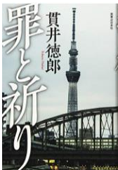
貫井徳郎 実業之日本社 Fヌ

誰からも実直で真面目と思われていた元警察官の父親の死。幼馴染みの警察官が捜査にあたり、息子も残されていた古い資料を調べていくうちに、未解決誘拐事件にお互いの父親の関わりの疑念が生まれ、葛藤を抱きつつ未解決事件の解明と父親の死の真相にせまっていきます。