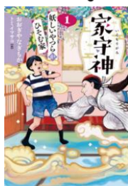
著：おおざやなぎちか 絵：トミイマサコ 出版社：フレーベル館 Fオ

築100年の古い家に引っ越してきた 拓は、祖父母との新しい暮らしの中 で、正体のわからない〈なにか〉の 気配におびえる。見えないものが見 える拓は、転校先で出会った妖怪好 き風花に背中をおされ、座敷にひ そむ存在と向き合うことに。それは 幽霊でも妖怪でもない「家守神」 だった。やさしい祖父母や友だちと の関わりの中で、拓は恐れと向き合 いながら少しずつ成長していく。 「見えないものも“ある”という 先生の言葉が心に残る、過去から続 く家と人のつながりを感じさせる物