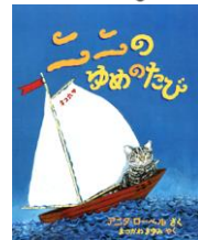
作：アニタ・ローベル 訳：まつかわまゆみ 出版社：評論社 Eロ

まち いえ 町の家でくらすネコの二ニは、いつも の窓辺で日向ぼっこをしていると、家 の人たちが荷物をまとめて出かける ようすに気づき、「もしかして置いてい かれるの？」と不安でいっぱいになり ます。やがて専用のかばんに入れられ た二ニは、ゆらゆら揺られるうちにうとうとと眠 り、気球で空を飛び、海をこえ、ゾウの背中や 木馬に乗る夢の旅へ。目を覚ますとそこは新しい 場所。置いてきぼりではなく、大切に連れてきて もらえたことにほっとします。色彩豊かな絵とと もに、うとうとと眠ってしまった二ニの夢の世界 での大冒険が描かれている楽しいストーリーです。