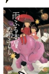
あめ ほんや 雨ふる本屋の あめ 雨ふらし