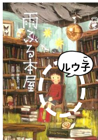
作：日向 理恵子 絵：吉田 尚令 出版社：童心社 F7