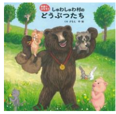
作・絵：くせさなえ 出版社：偕成社 Eク

しゅわしゅわ村には、にぎやかで楽しいどうぶつたちがいっぱい! お祭りのじゅんびをするタヌキさんや、トランポリンではねるウサギさんなど、みんな思いにすごしています。この絵本のすごさは、絵をながめるだけで自然に「手話」がおぼえられるところ。どうぶつたちのポーズをまねするだけで、いつのまにかおしゃべりができちゃうかも! 手話や指文字のやさしい解説もついているから、はじめての人でもだいじょうぶ。みんなも一緒に、手でお話ししてみませんか?