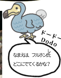
ドードー Dodo なまえは フルホシ どこにでくるかな?